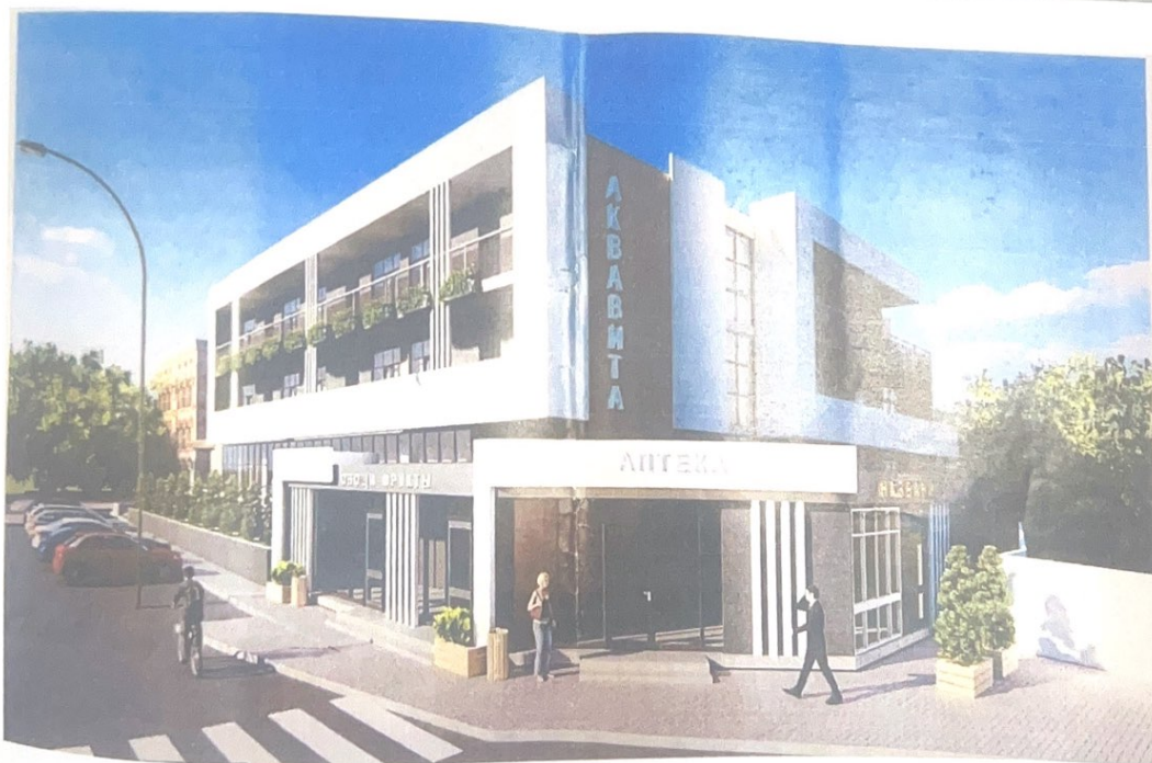
Фото №1, №2: место размещения объекта капитального строительства.