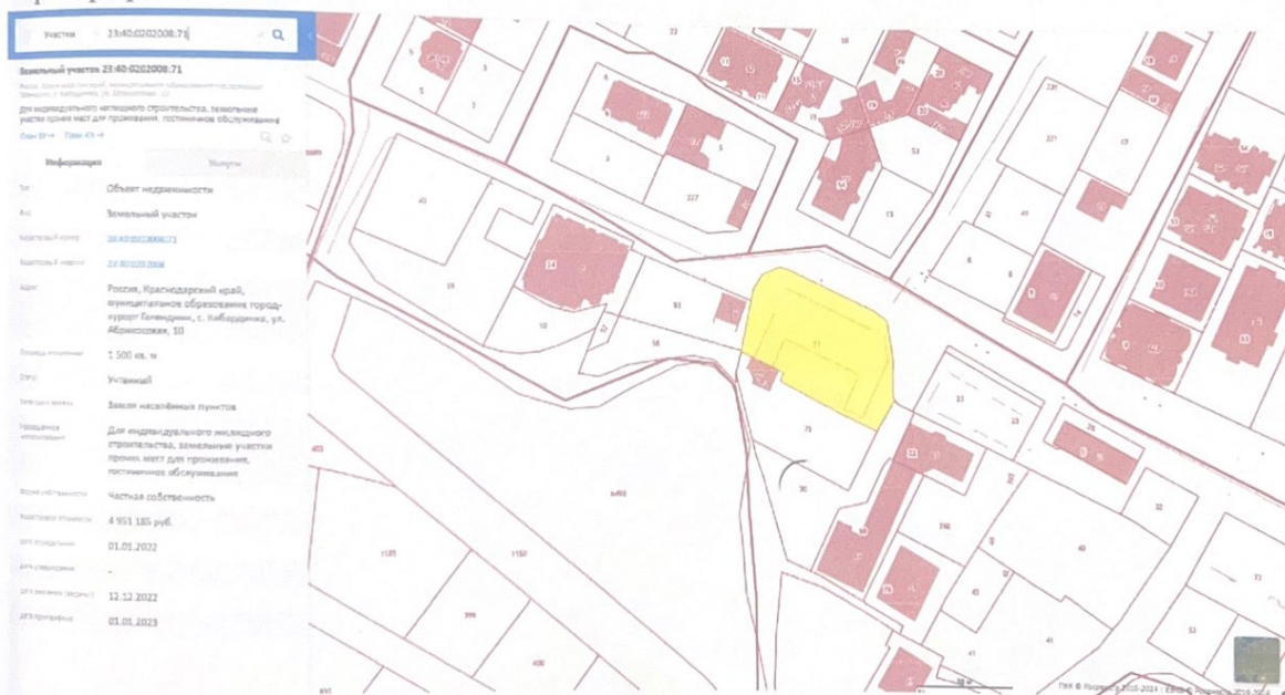
Схема №2 – размещение обследуемого объекта на карте г. Геленджика с использованием космического снимка

Схема № 1 - выкопировка с публичной кадастровой карты: