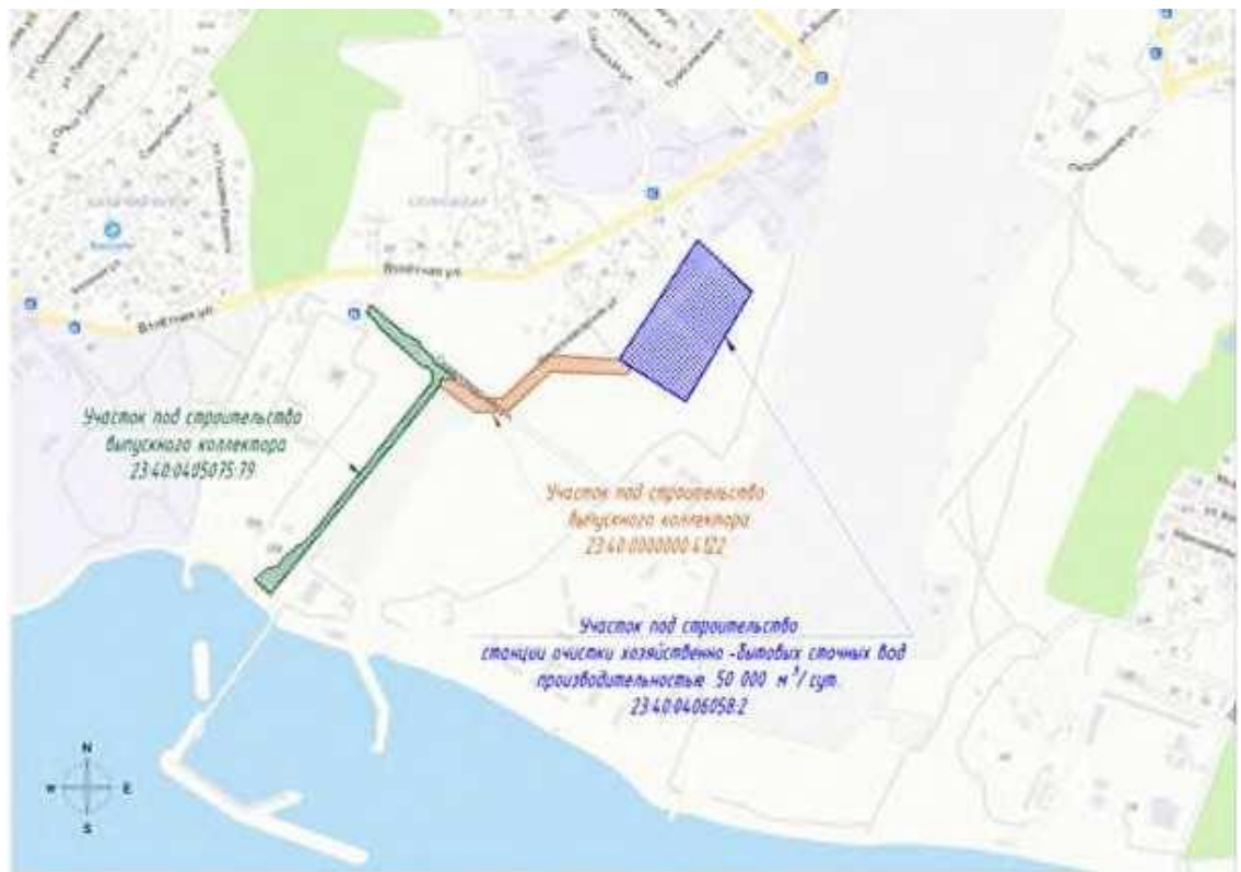
Рисунок 1 – Ситуационный план расположения объекта

Размещение проектируемых канализационных очистных сооружений (КОС) предусматривается на проектируемой площадке, расположенной на земельном участке с кадастровым номером 23:40:0406058:2, располагающемся в районе ул. Солнцедарской