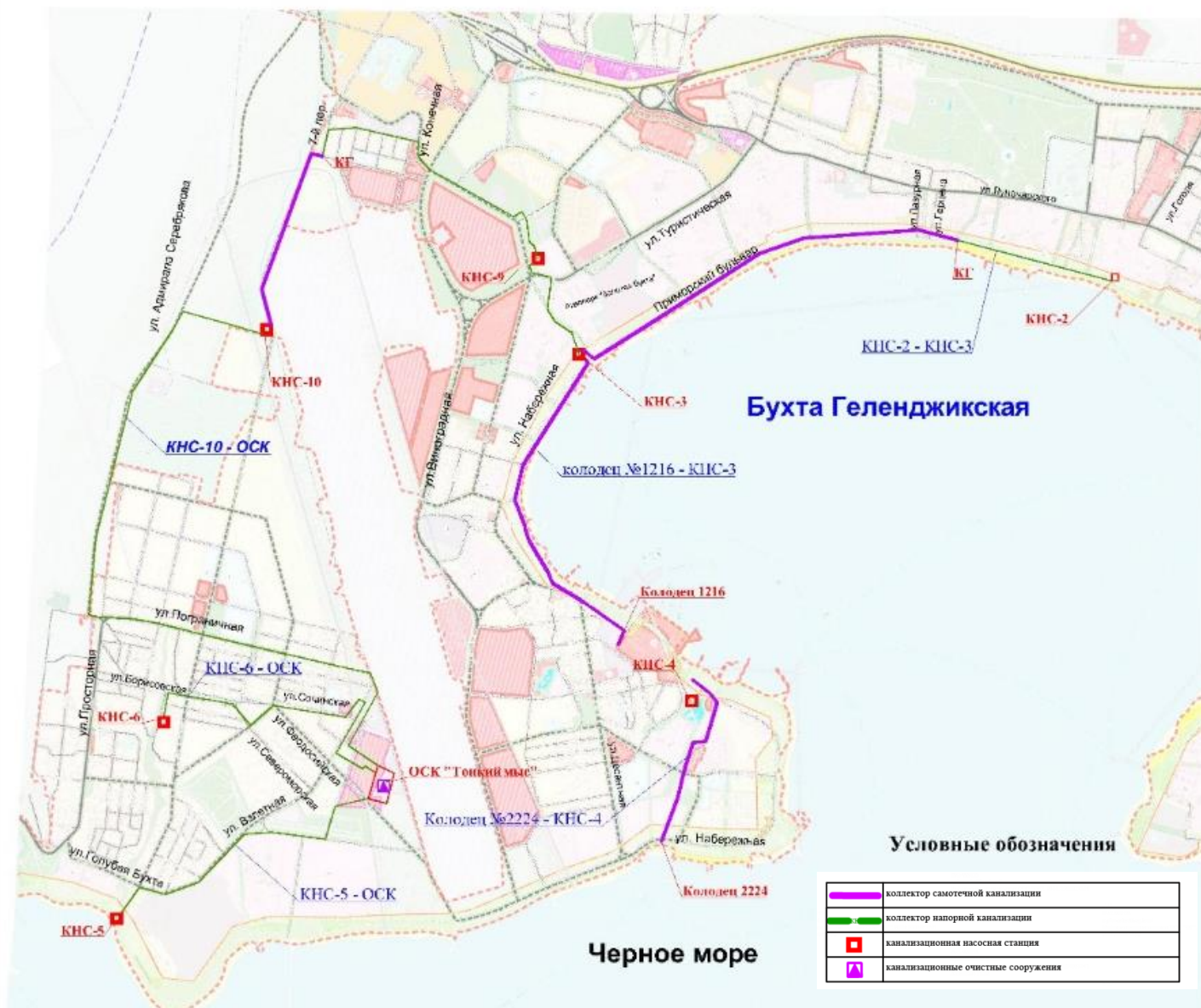
Схема трасс левой (западной) части Геленджикской бухты.